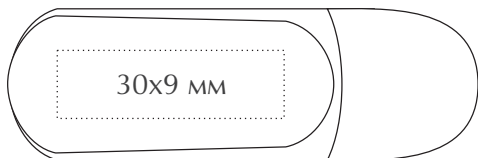
Оборотная сторона (с клипом)